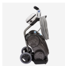
Chariot de transport