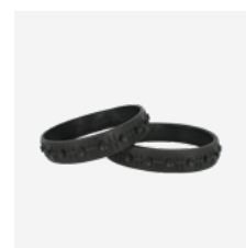
Pneus pour carrelage